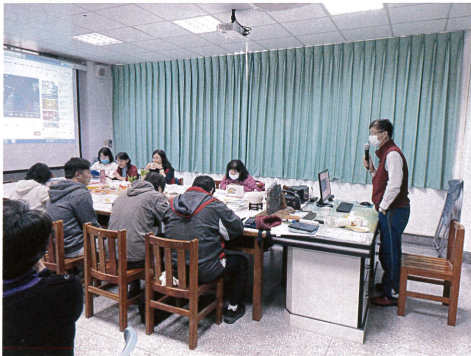
日期：111/02/24 地點：信義國民小學 說明：團務增能與專業成長