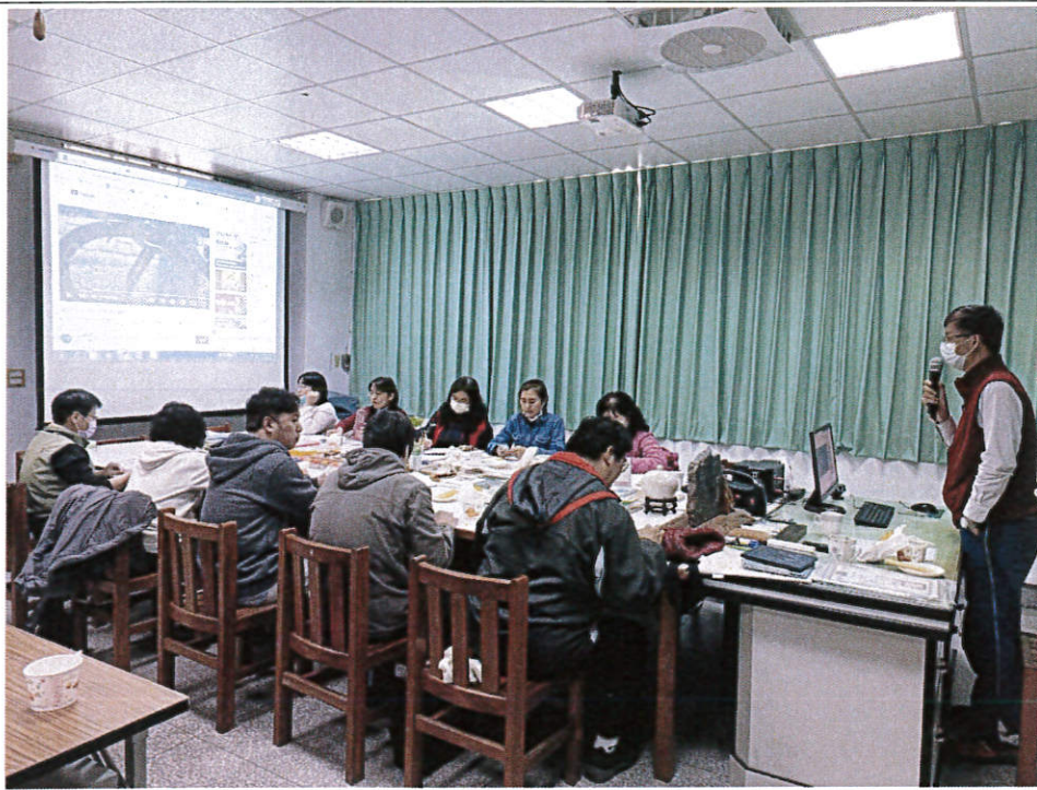
日期：111/03/17 地點：信義國小 說明：團務增能與專業成長