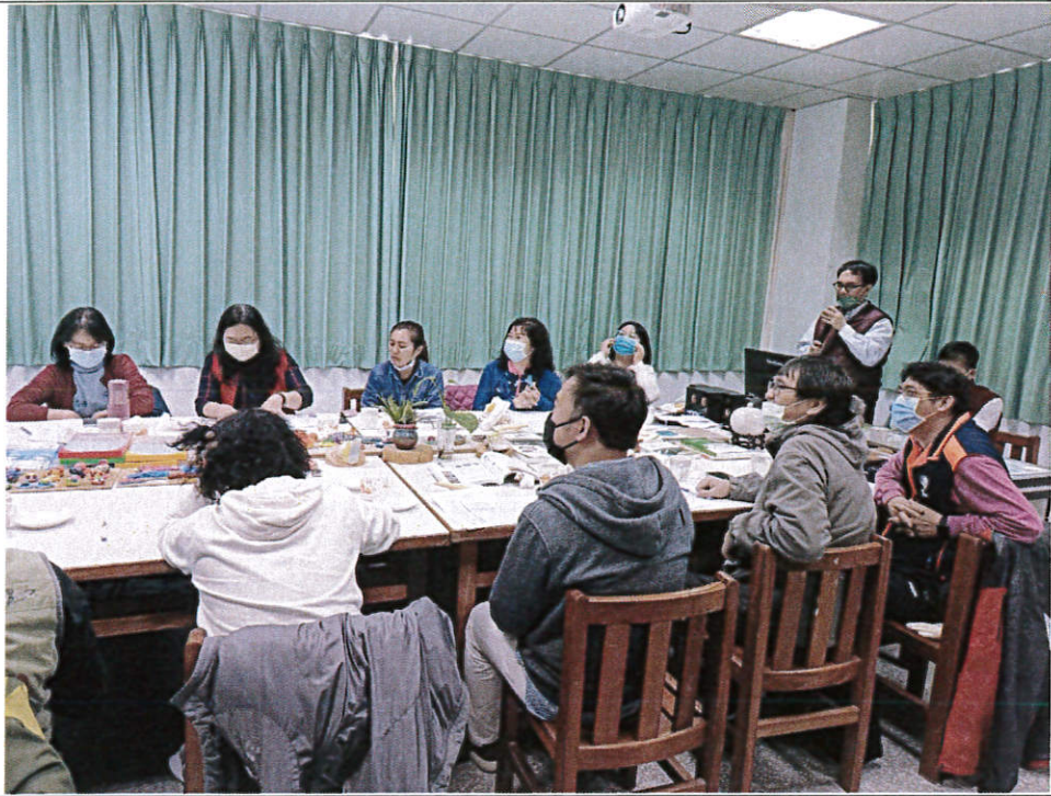
日期：111/02/24 地點：信義國民小學 說明：團務增能與專業成長