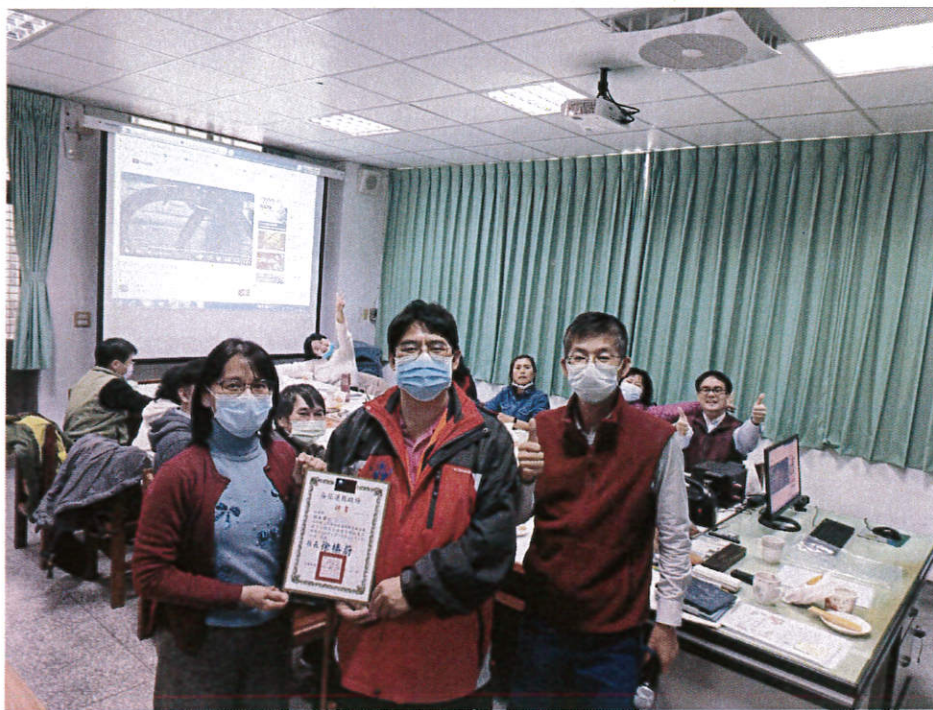
日期：111/03/17 地點：信義國小 說明：團務增能與專業成長